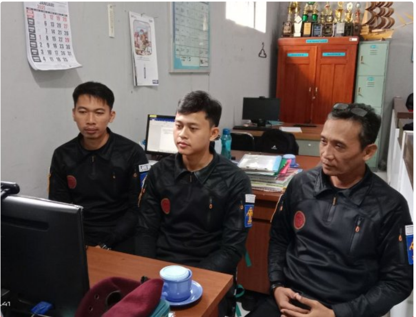
Bangun Harmoni dan Strategi, Lapas Besi Ikuti Webinar Refleksi Akhir Tahun 2024 & Resolusi 2025

CILACAP – Sebagai salah satu langkah dalam pengembangan kompetensi bagi Aparatur Sipil Negara (ASN), Petugas Lembaga Pemasyarakatan Kelas IIA Besi